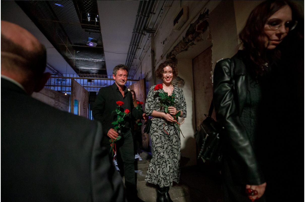
Pokaz spektaklu „Przez ścianę” – Warszawa, 24 kwietnia 2024.