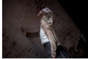
Pokaz spektaklu „Przez ścianę” - Warszawa, 24 kwietnia 2024.