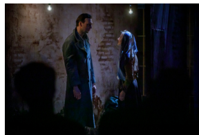
Pokaz spektaklu „Przez ścianę” - Warszawa, 24 kwietnia 2024.