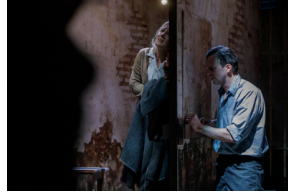
Pokaz spektaklu „Przez ścianę” - Warszawa, 24 kwietnia 2024.